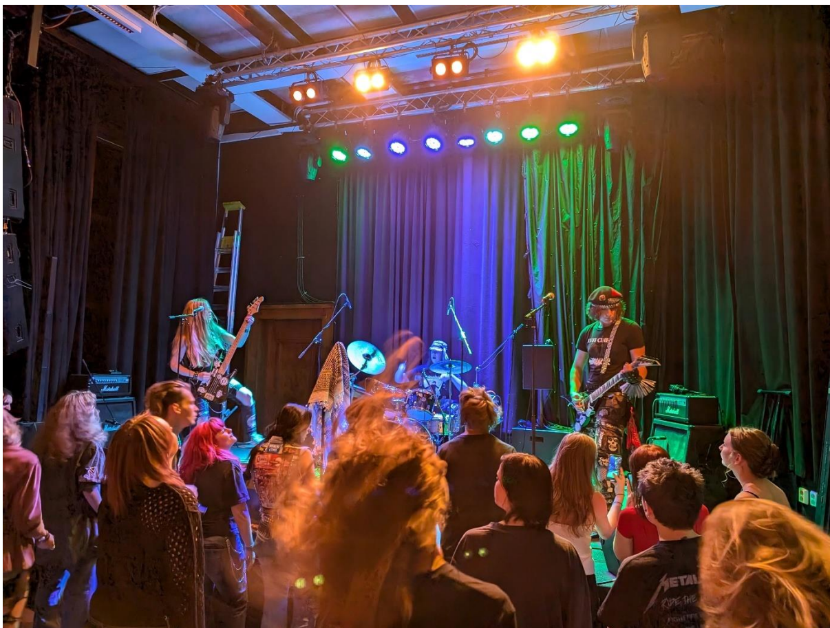
Kulturföreningen Sub i Östersund hjälpte unga arrangörer att göra en konsert på Tingshuset augusti 2024

Även bland förbundets anslutna utövare märks fortsatta samt ökade svårigheter i att få uppdrag, till stor del till följd av bristen på stöd till relevanta arrangörer och andra aktörer. Musiker, dansare och komponister inom det subkulturella fältet är ytterst sällan aktuella för anställning på institutioner eller särskilt kommersiellt attraktiva, vilket gör den ideellt organiserade sektorn till en otroligt viktig uppdragsgivare för subkulturernas professionella utövare. När stöden inte når de alternativa subkulturernas infrastrukturer blir utövarna lidande.