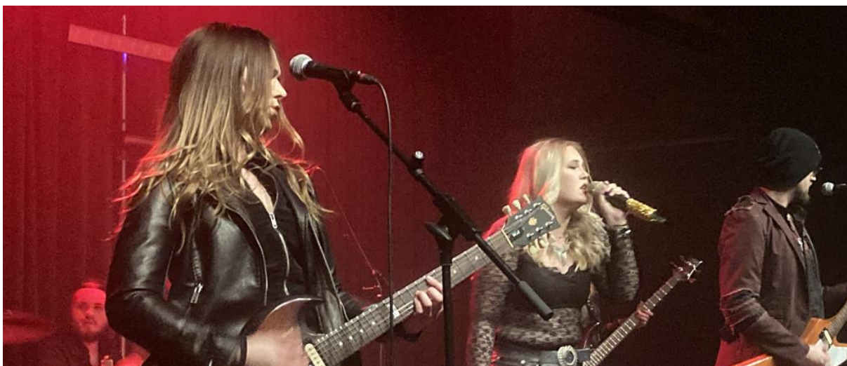
Northern Ladies på Alternativfesten, arrangerat av AlternativaCultura.