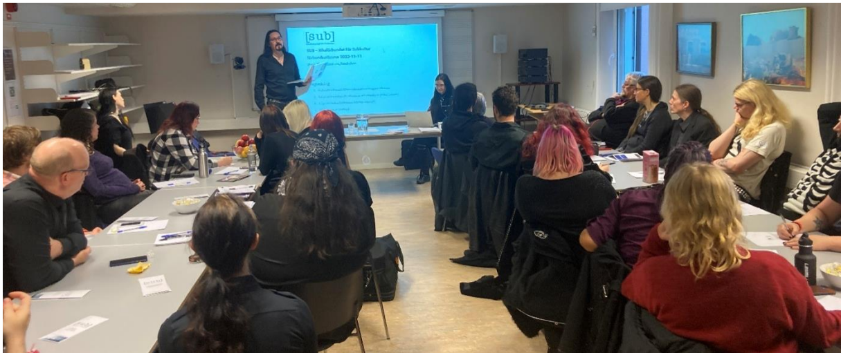
SUB – Riksförbundet För Subkulturs senaste förbundsstämma, 2023.