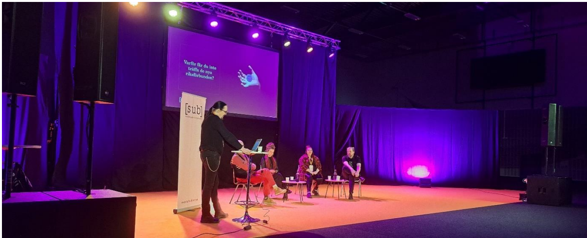
Programpunkten "Varför får du inte träffa de nya riksförbunden?" på Folk och Kultur 2024,